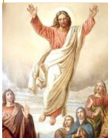
ASCENSION DU SEIGNEUR Jeudi 13 mai