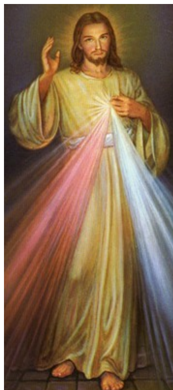
DIVINE MISERICORDIE Dimanche 11 mars