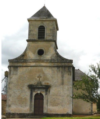
Notre Dame de la Nativité BENEUVRE